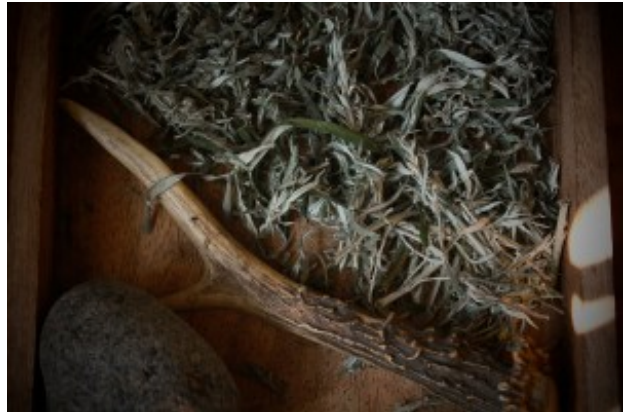
Weisser Beifuss

Sein Duft ist herb bis würzig und sehr intensiv. Er mischt sich gut mit Lavendel und Rosmarin zu einem Räucherwerk.